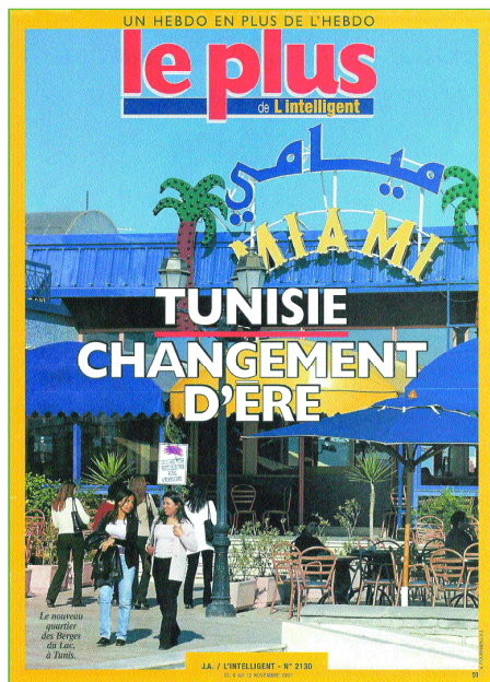
Photo 3/ Le café Miami, un lieu pour la promotion de l'image de la Tunisie