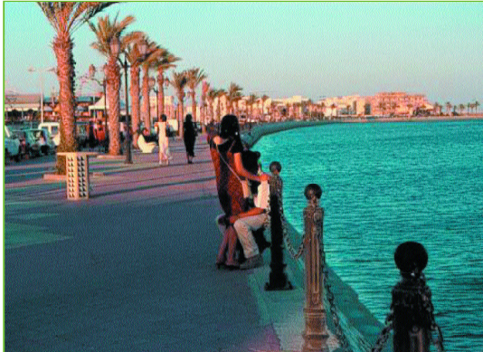
Photo 1/ Un couple enlacé sur la corniche Négociation des actes et transgression des normes des espaces publics traditionnels (août 2002).

qui leur sert ainsi de décor. Une esplanade surplombe la corniche de trois mètres et s'ouvre en amphithéâtre sur le plan d'eau (fig. 2). Elle mêle le minéral du pavage du sol et le végétal du petit jardin qui a été réalisé en son centre. Neuf établissements, cafés ou restaurants, la bordent, abrités par des galeries couvertes réalisées dans des matériaux très modernes (verre fumé des arcades, aluminium et vitres transparentes). Les terrasses sont protégées par ces galeries et débordent sur l'esplanade. Plus à l'ouest, plusieurs complexes de loisirs ont ouvert leurs portes depuis 2002. Parmi eux, «la Pyramide» se présente comme une petite station d'animation intégrée qui comprend une piscine, un centre de minceur, une discothèque, un restaurant et une salle de mariage. La corniche mêle ainsi lieux marchands et espace public de promenade ouvert sur la lagune. L'offre est très attractive et se diversifie au fil des années. Reste le problème de l'atterrissage des avions qui passent