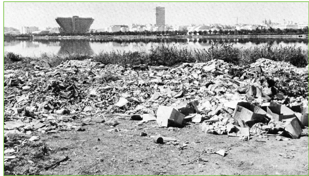
Photo 2 / Avant l'assainissement, les berges du Lac Nord, polluées vues en direction du centre-ville

du XIX e siècle, la lagune de Tunis a été l'objet de nombreux discours des Français, nourris de représentations très ambivalentes, mêlant l'idéologie moderniste et hygiéniste aux inspirations romantiques et orientalistes. Cet espace, pourtant salué pour sa beauté par une pléiade d'Européens, pue et fait horreur, à l'image de toute l'eau sale qui circule dans la Tunis du XIX e siècle et qui vient s'y déverser. Les points de vue sont discordants : à petite échelle à lire les descriptions des voyageurs, la rhétorique de l'éloge prime, tandis qu'à grande échelle, le discours devient dépréciateur lorsque l'observateur y regarde de plus près.