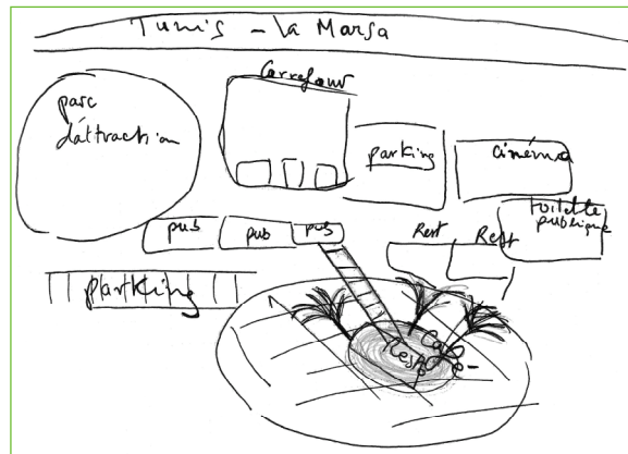
Fig. 3/ La corniche

À l'échelle du Grand Tunis, la corniche du Lac s'inscrit ainsi dans ce réseau de lieux de pratiques tournées vers la mer. Elle est un nouveau support spatial de cette maritimité contemporaine qui s'est construite dans la continuité d'un héritage de lieux et de pratiques déjà existants. Son décor et les pratiques sont semblables à ceux des autres lieux balnéaires. Dans la mesure où le plan d'eau n'est encore utilisé que de façon restreinte et du fait de la singularité de la lagune, qui n'est pas toujours associée au maritime dans les discours citoyens, on pourrait parler à son endroit d'une maritimité incomplète – la pratique de la baignade n'est d'ailleurs pas autorisée. En outre, elle diffère des lieux balnéaires de la banlieue nord par sa proximité avec le centre-ville et par le fait qu'elle est moins marquée socialement que les communes de La Marsa (avec ses quartiers huppés situés en front de mer de Gammarth, Marsa Cubes et Marsa-Corniche) et de Sidi Bou Saïd (fig. 1).