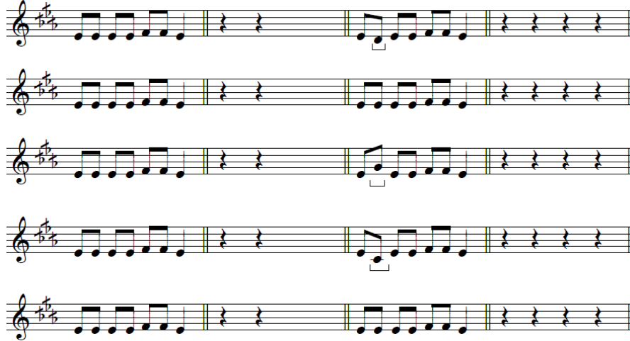
Tableau 2. Synonymie perceptive homonucléaire 2