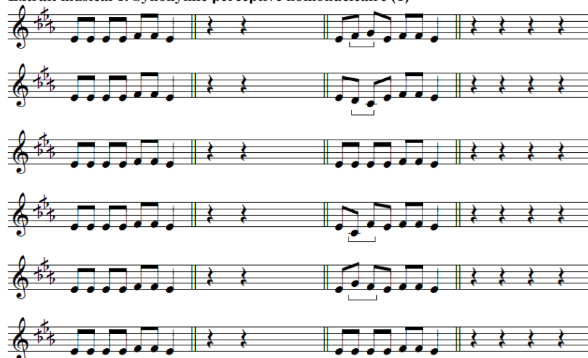
Tableau 1. Synonymie perceptive homonucléaire (1)