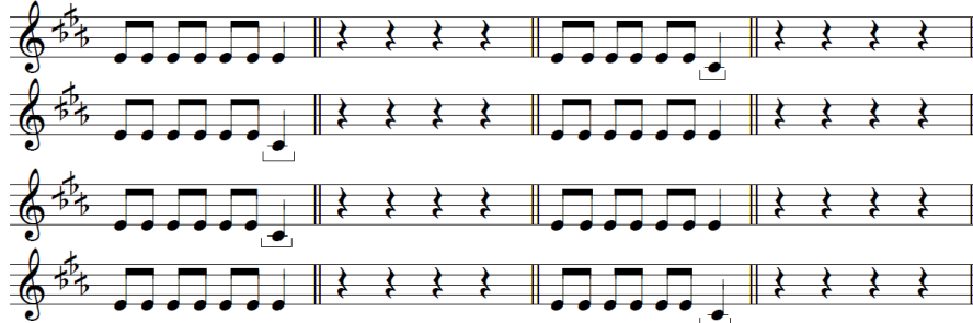
Tableau 4. Changement homonucléaire hétéromodal de finale