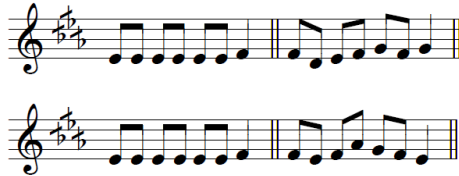
Tableau 8. Repérage de la finale