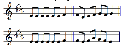
Tableau 8. Repérage de la finale