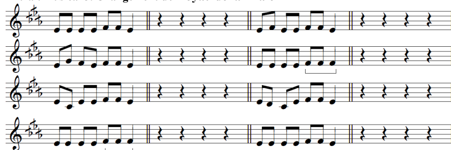
Tableau 3. Changement du noyau de la finale