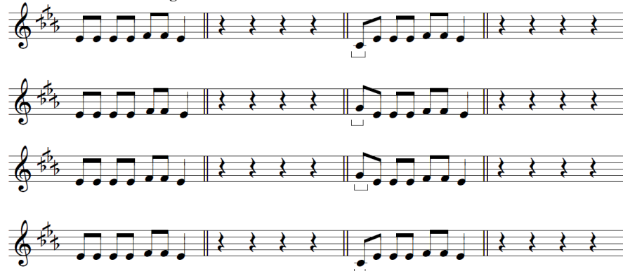
Tableau 5. Changement homonucléaire homomodal d'initiale