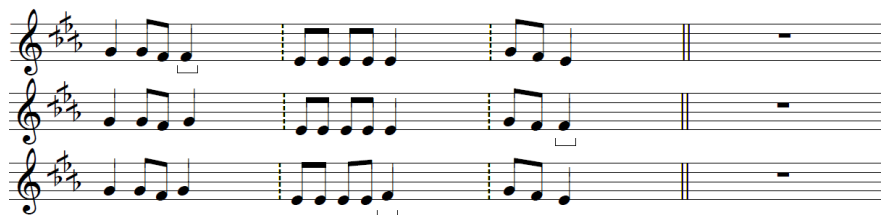
Tableau 10. Lignes nucléaires modales (2)